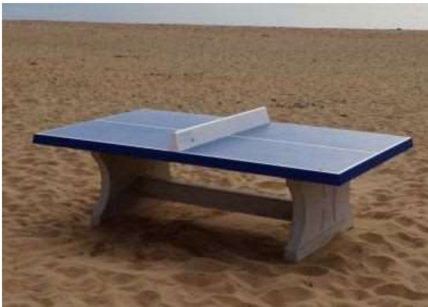
Afbeelding 1: Betonnen Tafeltennistafel, online prijs ca. 1500 euro.

Uit de interviews is gebleken dat er nog te weinig gedaan wordt met het strandje achter de dijk in Zoutkamp. Onze suggestie is om aandacht te besteden aan het uitbreiden van de faciliteiten op deze plek. Een uitbreiding van de uitrusting van het strandje kan zowel voor de leefbaarheid als voor het toerisme bevorderend zijn. Ideeën die hiervoor overwogen kunnen worden zijn bijvoorbeeld een betonnen pingpongtafel voor op het strand, zie Afbeelding 1. Deze tafels zijn erg duurzaam, bestand tegen vandalisme en daarom geschikt om langdurig te kunnen gebruik op een openbare plek. Een