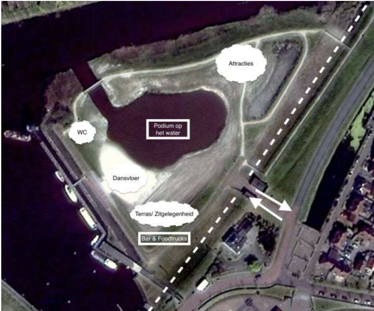
Afbeelding 3: Voorgestelde locatie en indeling terrein.

Het terrein heeft in totaal een grootte van meer dan 1.5 hectare. Op het terrein kan ruimte gemaakt worden voor stands of foodtrucks waarbij (lokale) horeca drank en eten aanbiedt met een terras/zitgelegenheid in de buurt van deze stands. Daarnaast kunnen attracties mogelijk geplaatst worden zoals een festival-reuzenrad met uitzicht over Zoutkamp, de jachthaven en de omliggende natuur. Als laatste kan er vanaf het water muziek gespeeld worden, met het strand als dansvloer.